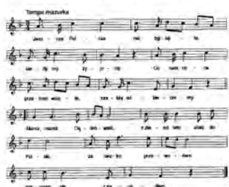
MAZUREK DĄBROWSKIEGO HYMN NARODOWY

Hymn to pieśń, którą śpiewamy podczas ważnych uroczystości, świąt oraz rocznic państwowych.